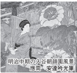
風景園筆 朝顔安達 入谷朝顔園 應需

福祿寿は中国の道士(仙人)で、その姿は短身、長頭、多髪で杖に巻物を結び鶴を伴い三徳具備の相を表してあります。尚、当山には安産、子育ての鬼子母尊神を勧請しております。又当地は江戸末期より朝顔造りが盛んであったので朝顔市が毎年7月6〜8日とり行われます。